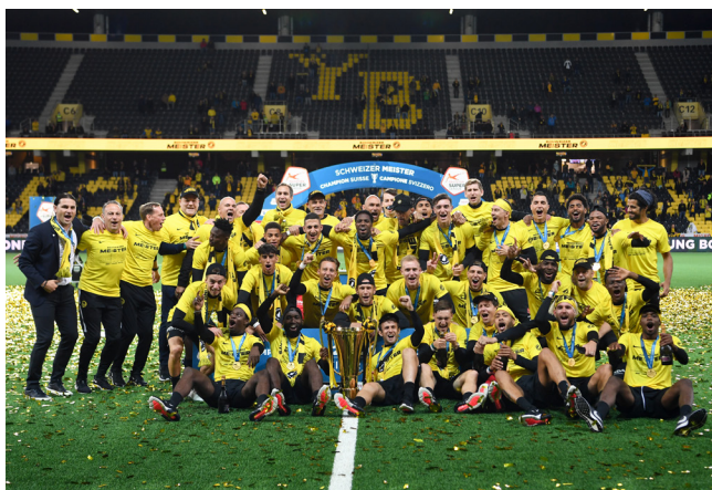
Zum vierten Mal in Serie feierte der BSC Young Boys den Meistertitel der Raiffeisen Super League.