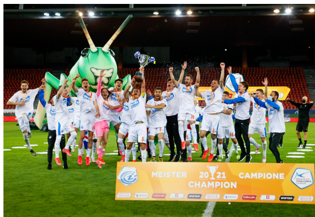
Den Meisterpokal der Brack.ch Challenge League sicherte sich der Grashopper Club Zürich.